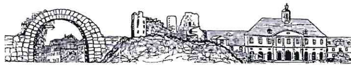
SIEBURGSCHULE - GRUNDSCHULE - BAD KARLSHAFEN

Sieburgschule, Carlstraße 27, 34385 Bad Karlshafen, Tel.: 05672-2839, Fax: 05672-925341 poststelle@sieburgschule.bad-karlshafen.schulverwaltung.hessen.de www.sieburgschule.de